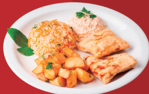
Peixe à Caçara

(merluza à dorê, batata sauté, arroz à grega e molho tártaro)