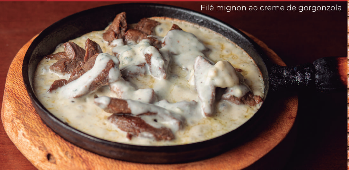
Filé mignon ao creme de gorgonzola