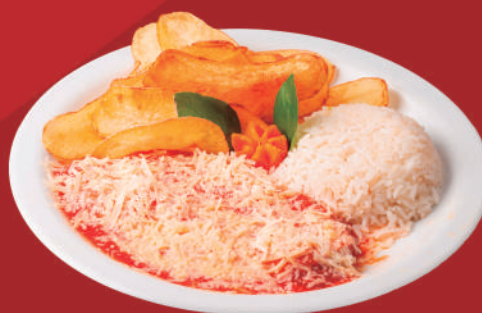
Parmegianinha de frango