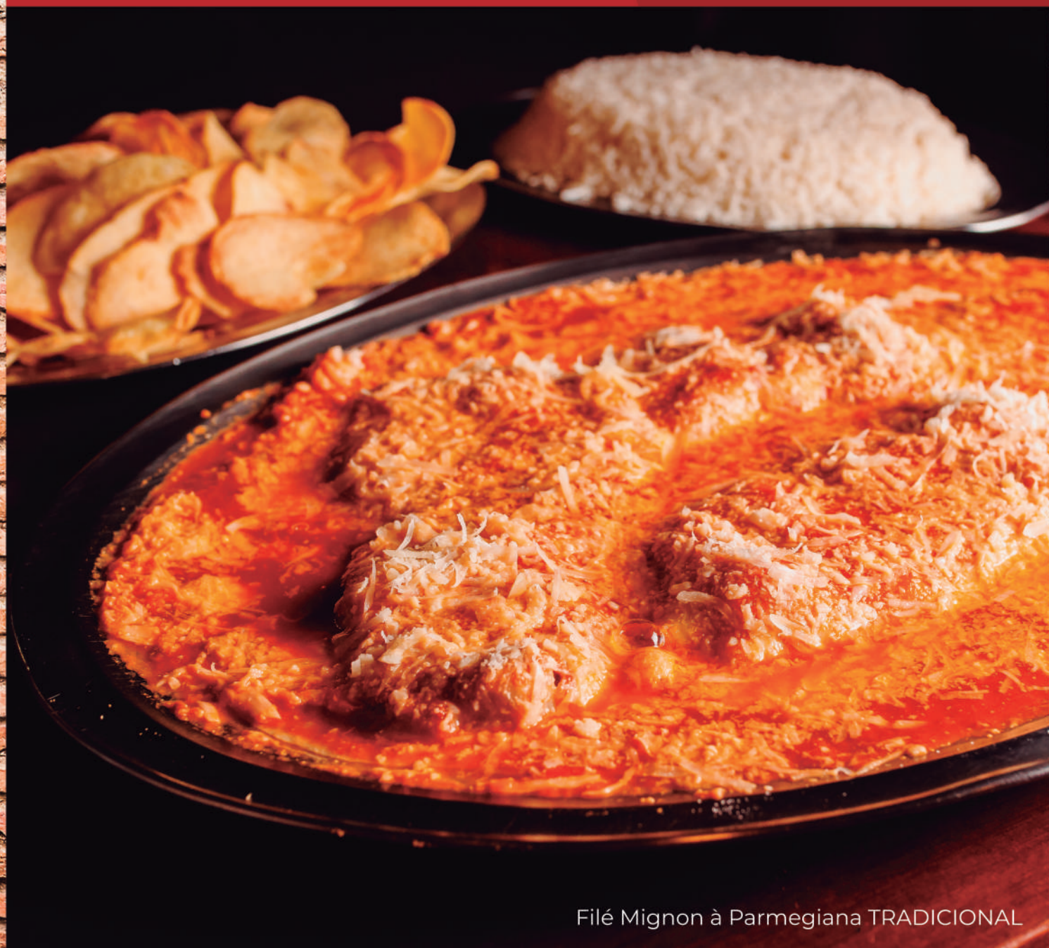
Filé Mignon à Parmegiana TRADICIONAL