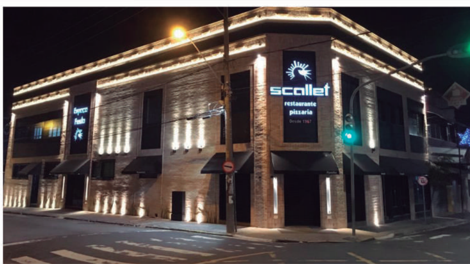
Fachada Nova (2017)

Tudo começou quando, nos anos 60, um casal simples de descendentes de italianos, vindos do campo, montaram um comércio aqui na esquina da rua 9 de julho com a Quintino Bocaiúva. De lá pra cá, quem pode contar melhor essa história são os milhares de funcionários e incontáveis clientes que por aqui passaram. Você é um deles! Certamente também tem uma boa história para contar, não é? Nos diga, qual é a sua relação com o querido Scalletão?