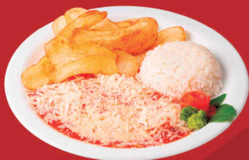
Parmegianinha de carne