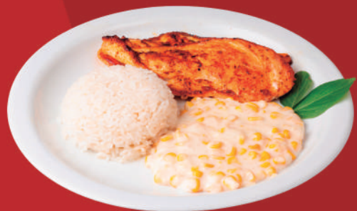
Franguinho da casa

(filé de frango grelhado, creme de milho e arroz)